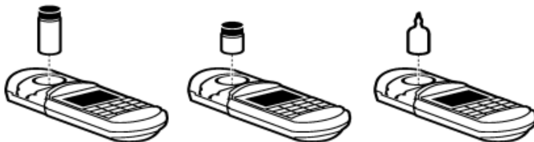
图 5 将样品放入样品池盒中

用不起毛的布或纸巾擦拭样品池,然后将样品池插入样品池盒中,并使菱形标记朝着键盘。